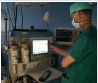
Überwachung im OP