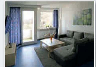
Wohnzimmer der PJ-Etage