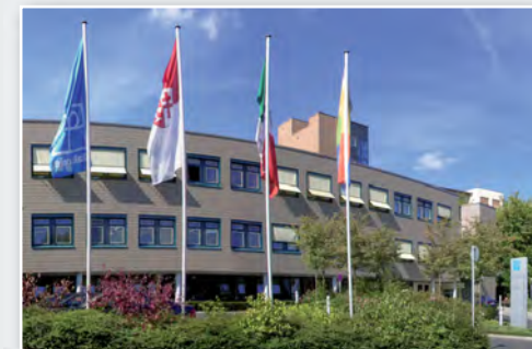
Unser Kreiskrankenhaus Rotenburg a.d. Fulda